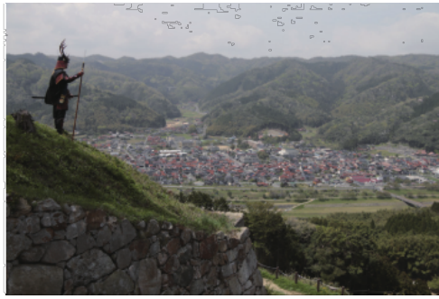
山頂三の丸から城下町を見下ろす。麓には堀の役目をした飯梨川が流れる。