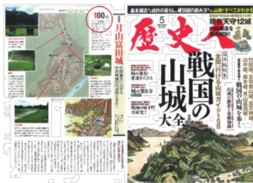
表紙（右）と 100 点評価部分

山城ブームのなか、今春発売のKK ベストセラー「歴史人」の特集・戦国の山城大全では、竹田城、高天神城などを抑えてナンバーワンに。時代の違う石垣や、土の白であった頃の名残などを見ることができ、満足度が高い。整備事業の結果、登りやすさも高評価。何と言っても実際の合戦の舞台であることが最大の魅力。