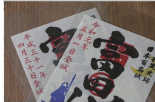
御城印が大人気。伝統工芸・広瀬和紙を使用し、山中鹿介のシルエットと三日月。