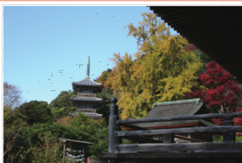
清水寺の三重塔 (約8km)