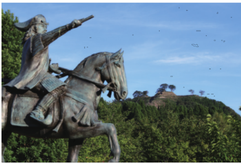
尼子経久公像と月山山頂。標高は約190m。中海や日本海を望むことができる。