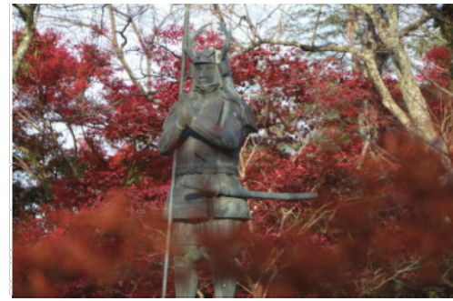
山中鹿介の祈月像。悲運の武将として人気が高い。ふなっしーも尊敬している。