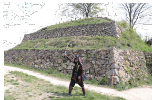
山頂三の丸の石垣。高石垣が築けない時代に、段によって高くした様子が分かる。