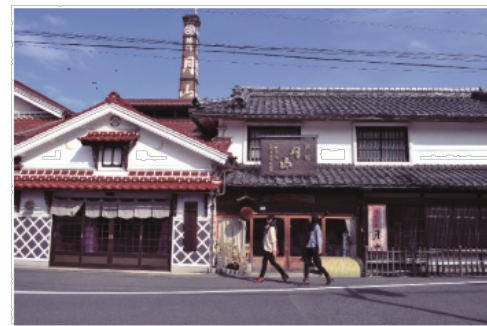
城下町の吉田酒造。島根県内でもトップクラスの銘酒をつくる。