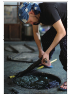
城下町にある天野紺屋では伝統工芸品である広瀬紺などを販売している。