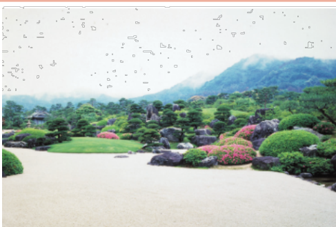
足立美術館の庭園 (約3km)