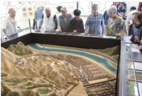
精巧なジオラマによって「戦う城」の細部まで可視化された。