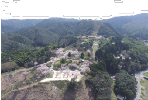
木々を伐採した整備事業の様子がよくわかる。サクラ読本の「桜」の名所、ルーツ。