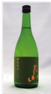
銘酒「月山」。超軟水からつくる酒は香りが高くフルーティーな味わい。